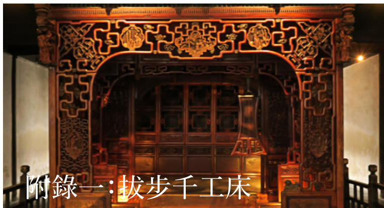
附錄一：拔步千工床