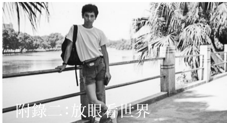
附錄二：放眼看世界